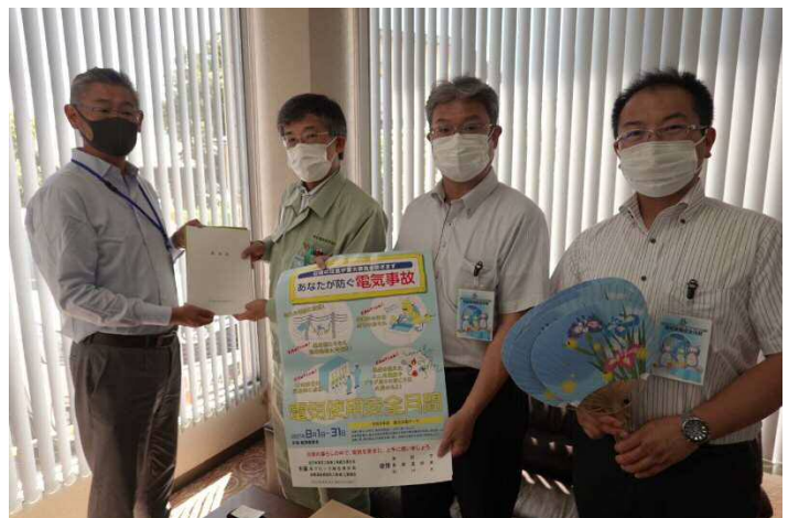
東北電気保安協会山形事業本部様にて