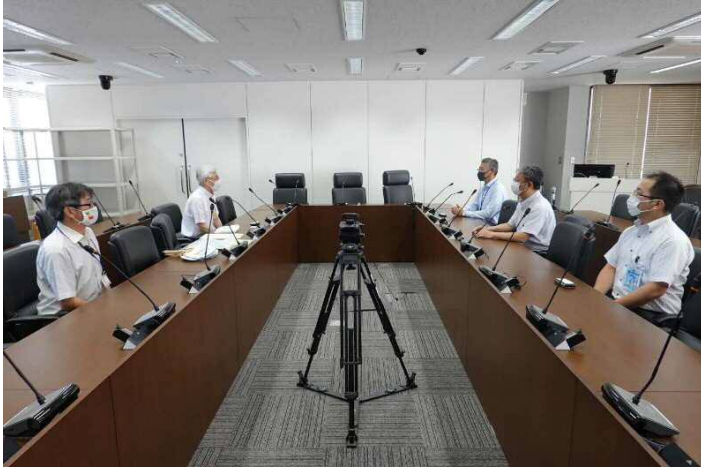
県庁 防災くらし安心部消防救急課様にて

8月の安全月間中に限らず日頃より市民の皆様へ電気の安全使用の呼び掛けをお願い致します。