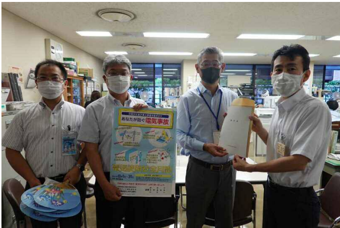
山形市役所総務部広報課様にて