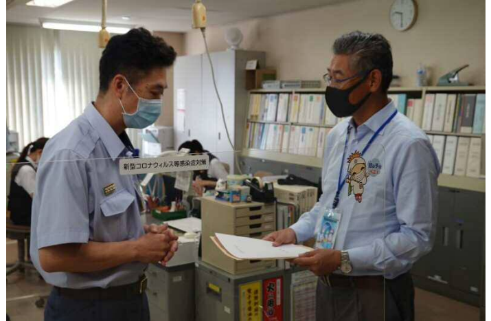
山形市消防本部様にて