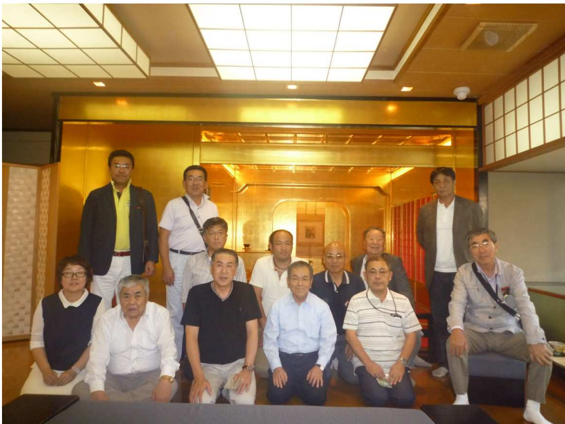
金沢金箔工芸店にて